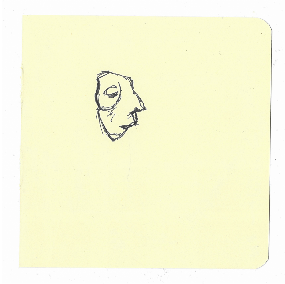
Dos calcetins quan plores Boli sobre paper, 16 x 16 cm, 2021